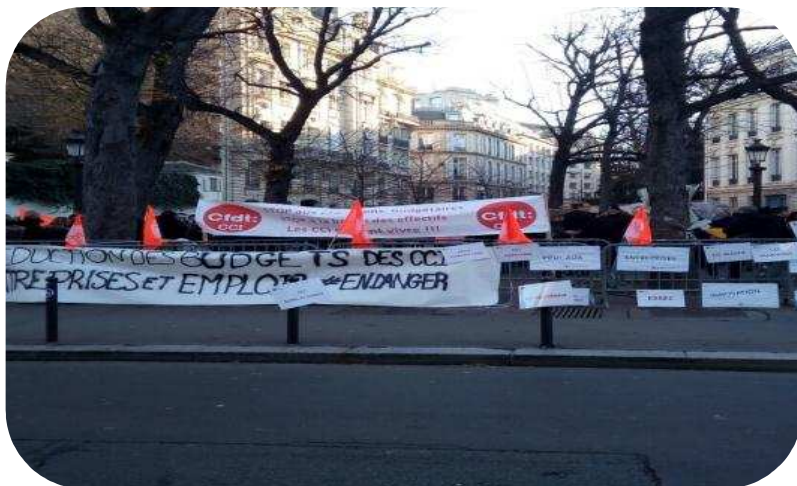
La CFDT-CCI contre la baisse de la ressource fiscale (Assemblée Nationale le 14/12/2016)

Depuis le début de l'année, nous avons interpellé le nouveau DG Grand Est pour lui rappeler qu'il devait tout mettre en œuvre pour sauvegarder les missions et les emplois et lui rappeler notre opposition la plus ferme vis-à-vis du raisonnement de certains DG de CCI Territoriales qui seraient tentés de procéder à d'éventuels licenciements pour pouvoir continuer à acheter du champagne et des petits fours pour leurs élus.